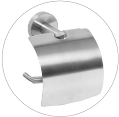
držák toaletního papíru